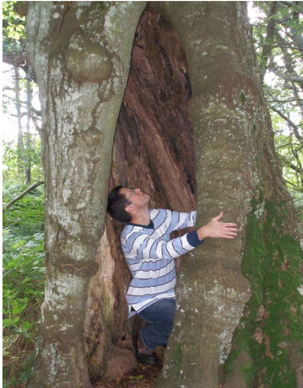
Inventering pågår.